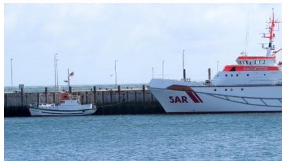
Liegeplatz auf Helgoland klein und groß.

Wir danken Jürgen Timpe für diesen Artikel in unserem Molenfeuer und erfreuen uns, dass unsere Vereinsschiffe so gut in Schuss sind. Interessierte an der Vereinsarbeit und dem Erhalt unserer Schiffe laden wir gerne zu unserem Stammtisch am 02. November 2022 um 19 Uhr im „Alten Speicher“ am Museumshafen ein.